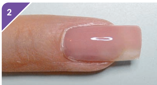
2 Rivesti la superficie dell'unghia con del gel per camouflage per 2/3 della larghezza, lascia asciugare.