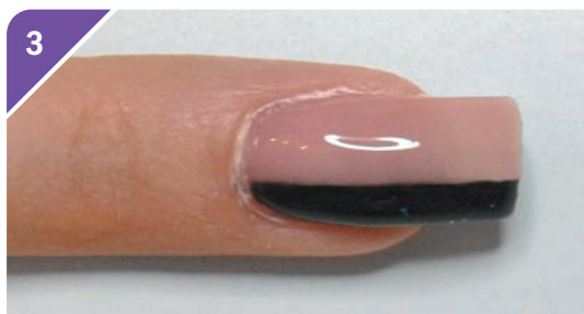
3 Opacizza la superficie, riempi il terzo libero con del gel nero, lascia asciugare. Completa la ricostruzione e dai la forma con la lima.