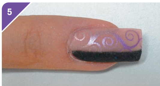
5 Comincia a spruzzare con l'aerografo il colore argento, poi ripassa la punta con il lilla.