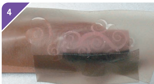
4 Copri la porzione nera dell'unghia con una protezione, quindi applica una mascherina autoadesiva pre-ritagliata.