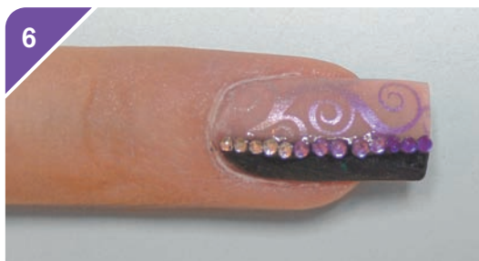
6 Applica infine degli strass lungo la linea e sigilla l'unghia con un gel lucidante.