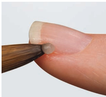
Crea una pallina di acrilico piccola e piuttosto asciutta