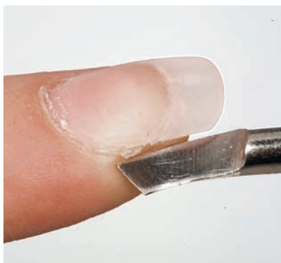
Lievi danni ai bordi possono causare problemi più gravi