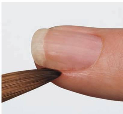
Uniforma il materiale all'unghia naturale