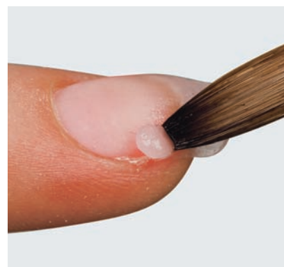
Rivesti la parte danneggiata con l'acrilico